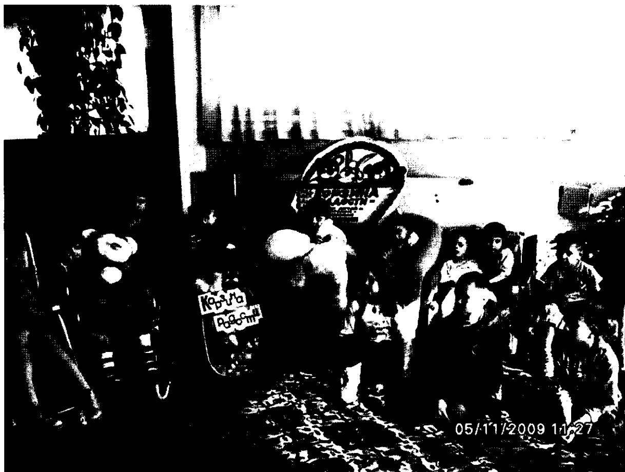
Торжественный момент акции «Корзина радости». Сотрудники детской библиотеки №3 передают в дар воспитанникам, «Центра реабилитации детей и подростков-инвалидов «Надежда» игрушки, развивающие игры, книги.

Участники мероприятия узнали много интересных фактов о происхождении картофеля. Например, то, что в Бельгии существует Музей картофеля, где собраны марки, знаменитые картины, стихи, баллады, посвященные картофелю.