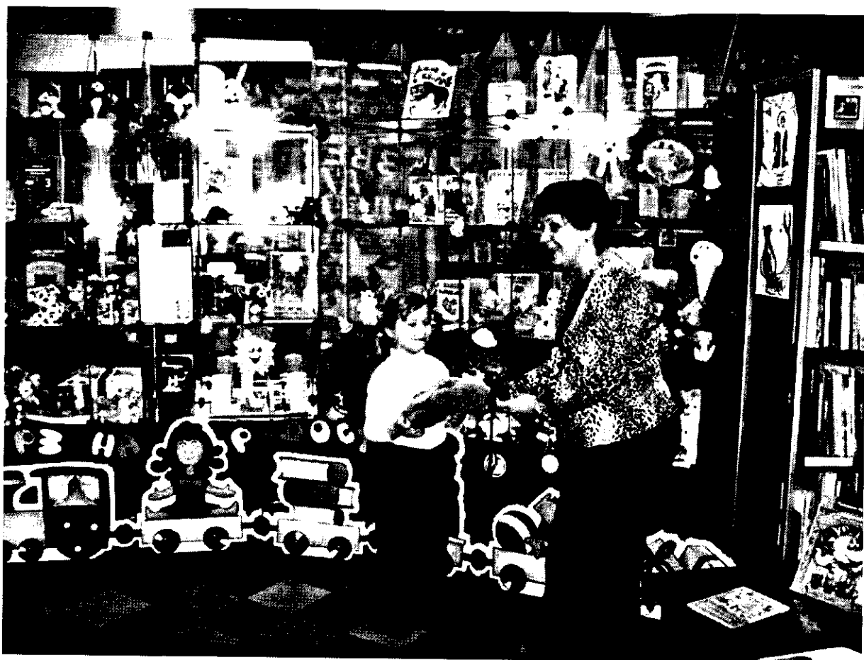
Некоторые юные читатели несли последние игрушки, пояснив организаторам, что есть дети, которым они нужнее. На фотографии — маленькая читательница ЦДБ вносит свою лепту в копилку добрых дел.

Пролетая над Землей, Истекаем мы слюною, На планете нашей тошно, Не растет у нас картошка. Овощи мы любим очень, К вам порой приходим ночью. Если бы не дачи ваши, Наши судьбы были б страшны.