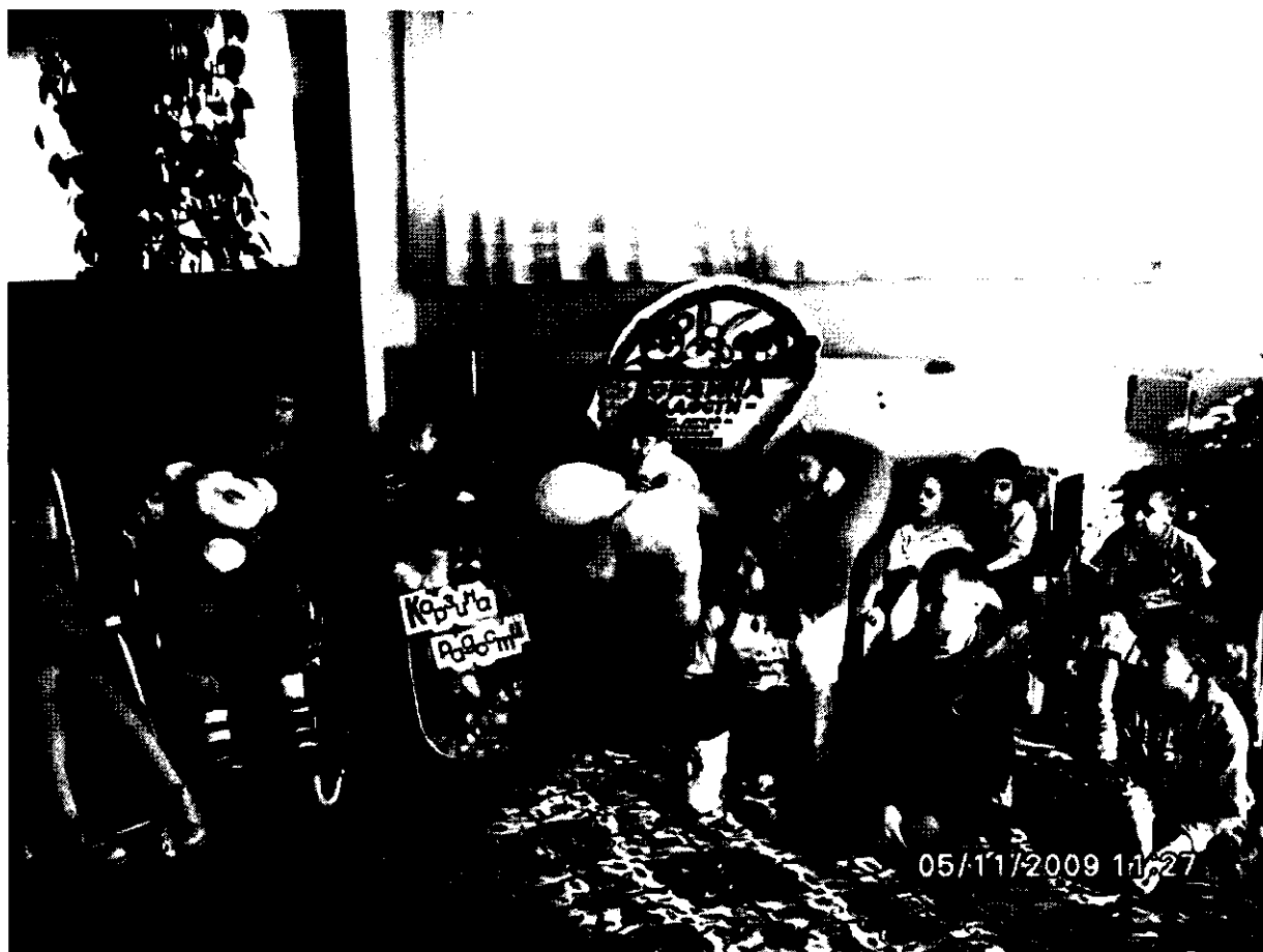
Торжественный момент акции «Корзина радости». Сотрудники детской библиотеки №3 передают в дар воспитанникам, «Центра реабилитации детей и подростков-инвалидов «Надежда» игрушки, развивающие игры, книги.

Участники мероприятия узнали много интересных фактов о происхождении картофеля. Например, то, что в Бельгии существует Музей картофеля, где собраны марки, знаменитые картины, стихи, баллады, посвященные картофелю.