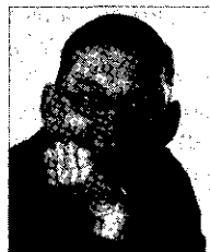
В.Г. Урин , генеральный директор Московского академического Музыкального театра им. К.С. Станиславского и Вл.И. Немировича-Данченко, заслуженный деятель искусств России

Союз театральных деятелей выступает за принятие нового закона о культуре. Но все-таки мы считаем, что это новая заплатка на старом платье, которое уже порядком пообветшало. Самое время шить новый костюм, который будет в пору культуре, и носить его будет не стыдно.