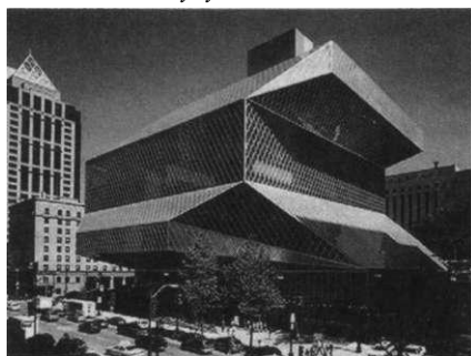
Центральная библиотека Сизтла

Иногда форма здания библиотеки отражает ценность хранимых в нём знаний: это может быть «алмаз», «бриллиант» или «раковина» и пр. Интересным с данной точки зрения является проект нового здания Национальной библиотеки Франции: в форме открытых навстречу друг другу четырёх книг. Казалось бы, архитектурный образ здания лишь банально повторяет форму предметов, хранящихся в нём; однако здание построено в период активной экспансии электронной информации и вытеснения традиционной книги, поэтому оно как бы «запечатлевает» на века уходящий предмет. Таким образом, здание обращено не столько к современникам, сколько к потомкам. Неслучайно в одном из своих выступлений Н. Фостер, архитектор здания, амбициозно заявил: «Мои здания будут стоять вечно».