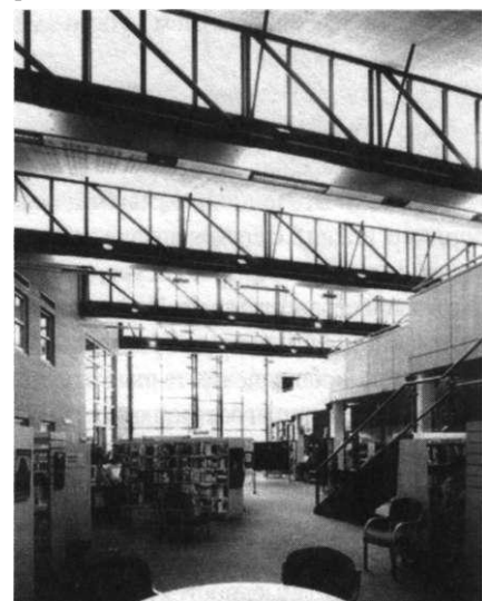
Библиотека Нпда! СоиШу (Council, Ирландия)

Можно рассматривать библиотечное здание и как часть общественного пространства. Общественное пространство реализуется в том числе в общественных зданиях — зданиях, отражающих, прежде всего, амбиции местного сообщества. Выступая в таком качестве, здание библиотеки строится более помпезным и значительным, чем это нужно самой библиотеке (например, Национальные библиотеки Беларуси или Татарстана). В оформлении используют мрамор, позолоту, произведения известных художников. Поскольку общественные интерьеры создаются значительно более изысканными и дорогостоящими, нежели интерьеры функциональных учреждений, не удивительно, что оформить новое здание библиотеки Московского государственного университета предложили 3. Цетрели.