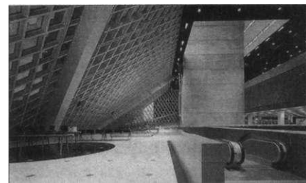
Центральная библиотека Сизтла. Фрагмент интерьера

соревноваться на равных страны, у которых есть богатейшая культура, и те, которые не могут ею похвастаться; страны, имеющие реальные средства на реализацию многомиллионных проектов, и те, у которых этих средств нет. Показателен в этой связи пример Латвии, в которой в настоящее время идут дискуссии о необходимости строительства нового здания Национальной библиотеки «Замок света», на строительство которого планируется взять кредит на 30 лет. Противники строительства окрестили проект «Замок конца света».