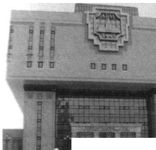
фундаментальная библиотека МГУ, Москва

Представлено библиотечное здание и в пространстве культуры, причём данное пространство оно формирует непосредственно, выступая в качестве ресурса или инфраструктуры культуры, позволяя сохранять и транслировать во времени культурные ценности. Поэтому столь явственно проявляется во внешнем виде библиотечного здания мемориальная функция: значительные по объёму хранилища бункерообразной эрмы (или формы других предметов для хранения).