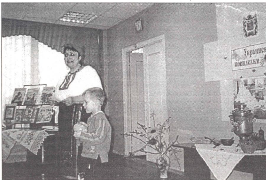
Детское мероприятие проводит украинская диаспора

ботка и реализация комплекса мероприятий по пропаганде миролюбия, повышению устойчивости к этническим, религиозным и политическим конфликтам, противодействию экстремизму.