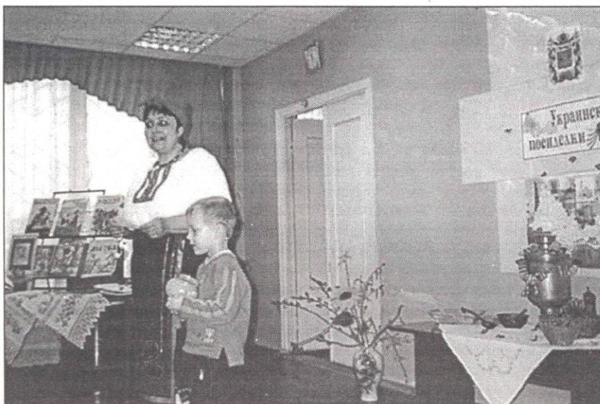
Детское мероприятие проводит украинская диаспора

ботка и реализация комплекса мероприятий по пропаганде миролюбия, повышению устойчивости к этническим, религиозным и политическим конфликтам, противодействию экстремизму.