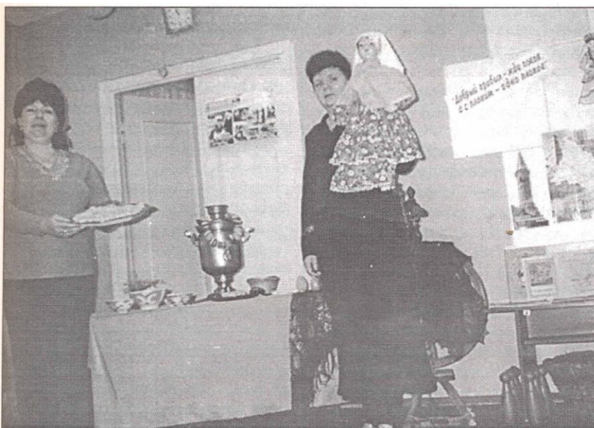
Занятие «Добрый прибыл - жди покоя», посвященное традициям татарского народа

За время пребывания в гостеприимной столице Оренбуржья участники конференции смогли познакомиться и с деятельностью нашего Информационно-досугового центра, целенаправленно работающего на развитие толерантного сознания, поддержку отношений взаимопонимания и дружбы между представителями различных этнических групп в многонациональном городе.