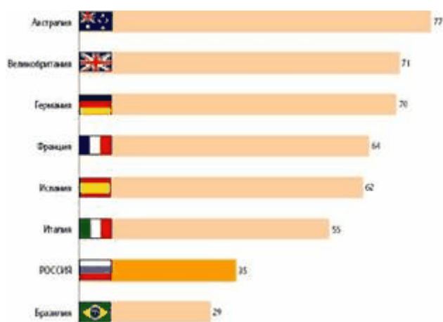
Рис. 1. Доля пользователей Интернета в странах, % от населения [4]

К середине 2009 г. 40 млн. россиян (35% населения РФ) являлись пользователями сети Интернет. Годовой прирост суточной аудитории сети в России составил 34%, полугодовой - 18,4% (см. рис. 1). Согласно данным декабрьского опроса