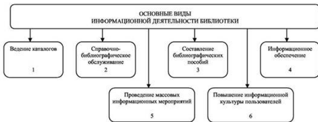
Рис. 1. Структура информационной деятельности библиотеки

В научных публикациях 2005 - 2009 гг. [9, 10, 12, 13, 16 - 25] уже констатируется использование ряда новых информационных технологий в библиотеках, на базе которых строятся новейшие виды информационно-библиотечных продуктов и услуг. Это блоги, вики, социальные закладки и теги, форумы, RSS-рассылки и т. д.