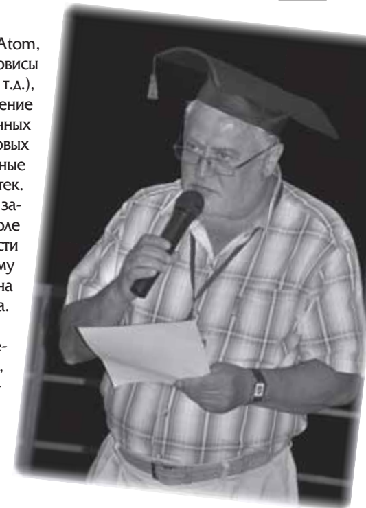
Верховный судья Б.И. Маршак

Ещё одна из актуальных тем конференции – защита персональных данных,