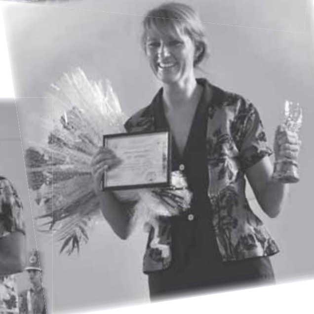
Мисс конференции 2011 г. – Светлана Журова