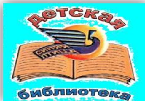
Детская библиотека № 8 «Синяя птица»