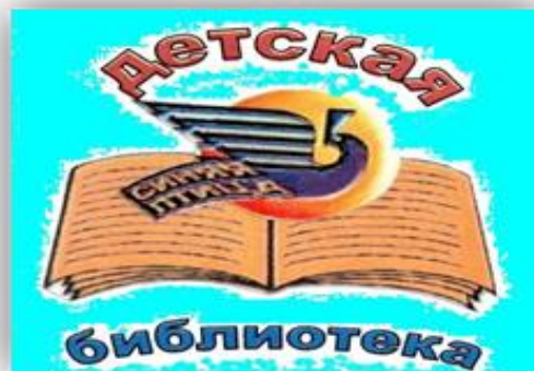
Детская библиотека № 8 «Синяя птица»