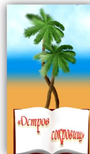
Детская библиотека № 11 «Остров сокровищ»