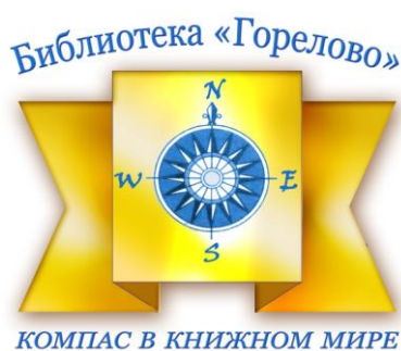
Библиотека № 4