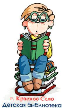
Детская библиотека № 7