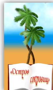
Детская библиотека № 11 «Остров сокровищ»