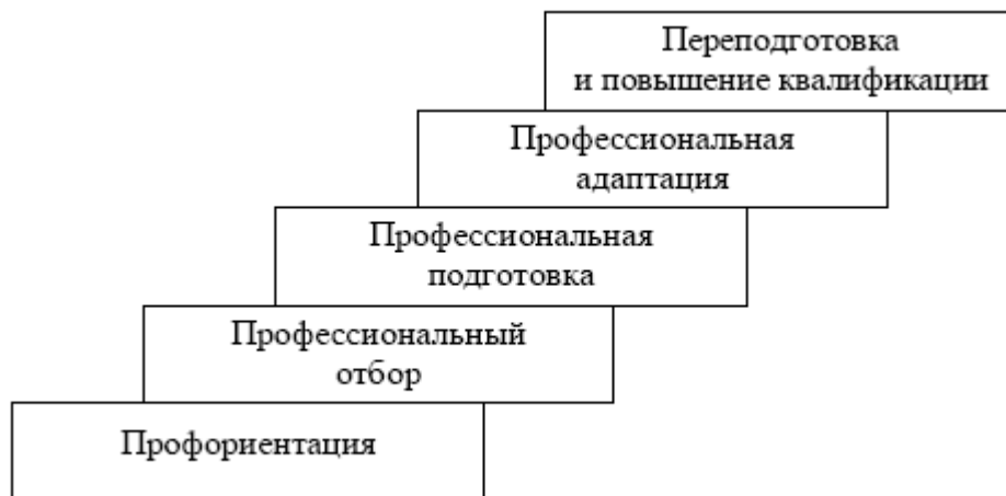
Рис. 3. "Лестница" профессионализации

профессионального становления личности, формирования, реализации и развития профессиональных способностей именуется профессионализацией (рис. 3).