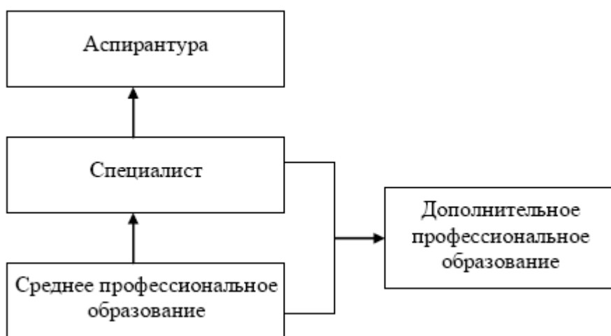
Рис. 1. Структура непрерывного библиотечного образования (до перехода в 2010 г. на ФГОС СПО и ФГОС ВПО)

Переход на компетентностную модель профессионального обучения, осуществленный в России в 2011 г., углубил уровневую дифференциацию подготовки квалифицированных кадров. Так, ФГОС СПО по специальности 071901 "Библиотечноеведение" предусматривает базовую и углубленную